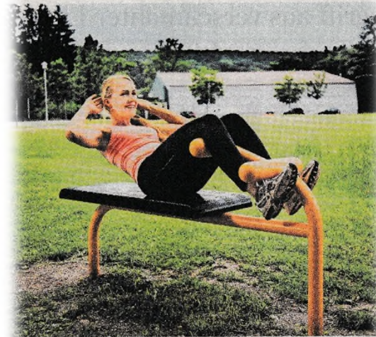
Sportler stählen ihre Muskeln unter freiem Himmel